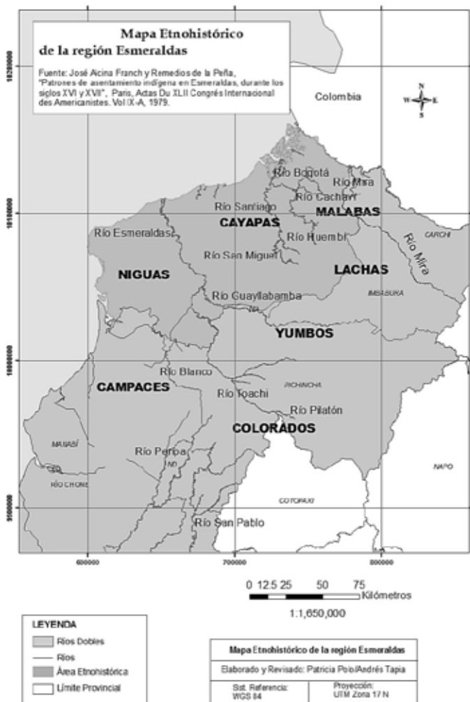
Ilustración 2: Mapa etnohistórico de Esmeraldas, primera mitad del siglo XVI.